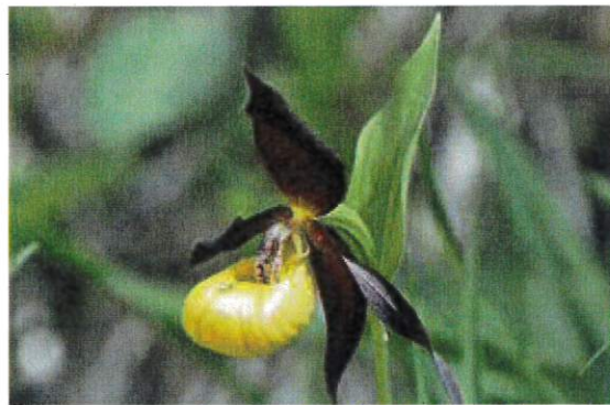
sabot de Vénus (orchidée)